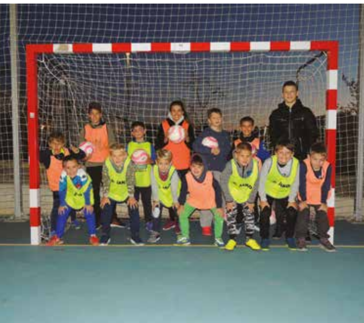
Foto klub Krk

Fotoklub Krk organizator je četvrte po redu međunarodne izložba fotografija Summer Sea Sun 2020. koja je 15. listopada ove godine svečano otvorena u galeriji Toš u Puntu.